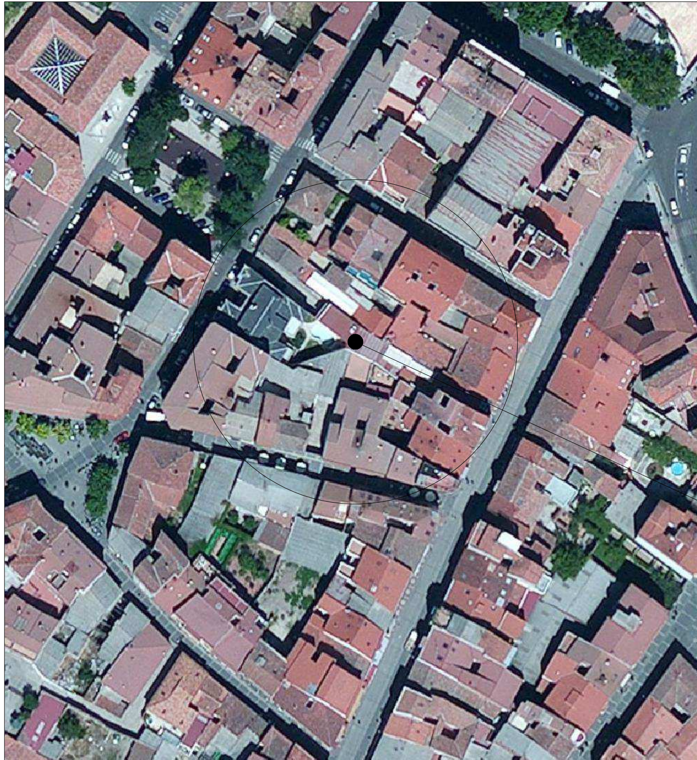
ORTOFOTO E 1:1.000.